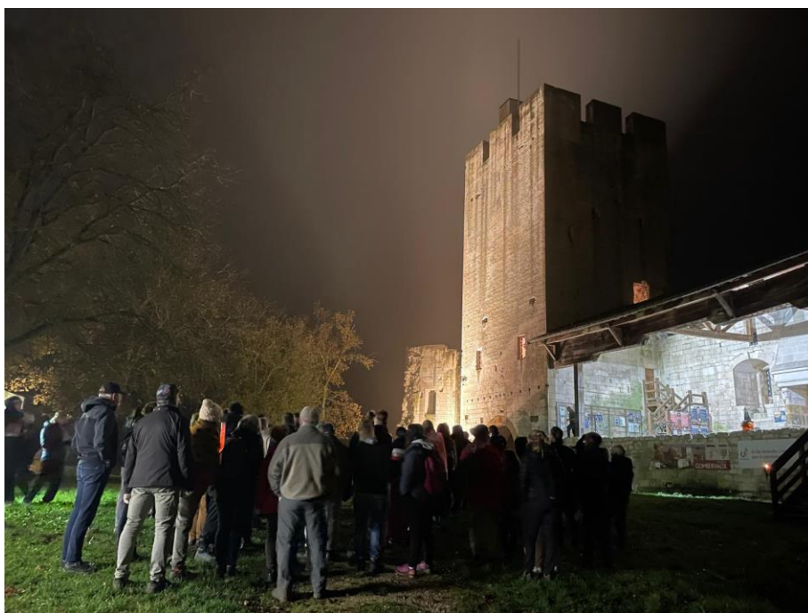
Les marcheurs dans la cour du château avant le départ, 31 octobre 2024

Le jeudi 31 octobre l'association a organisé pour la deuxième fois une marche nocturne suivie d'une soirée Halloween au château, toujours en collaboration avec Le pied champêtre. L'évènement a une nouvelle fois été un succès avec plus de 200 marcheurs et une belle soirée