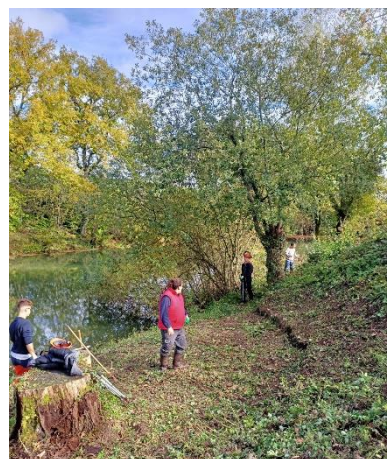
Le groupe de l'IME en train de débroussailler les abords des douves, 22 octobre 2024