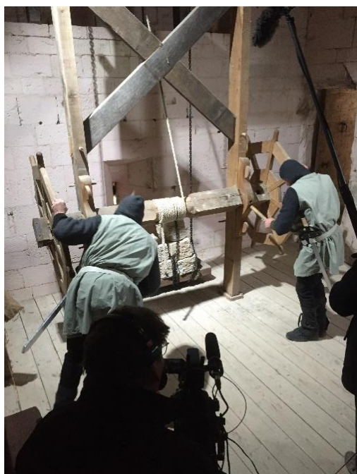
Photo prise pendant le tournage, timonerie du donjon