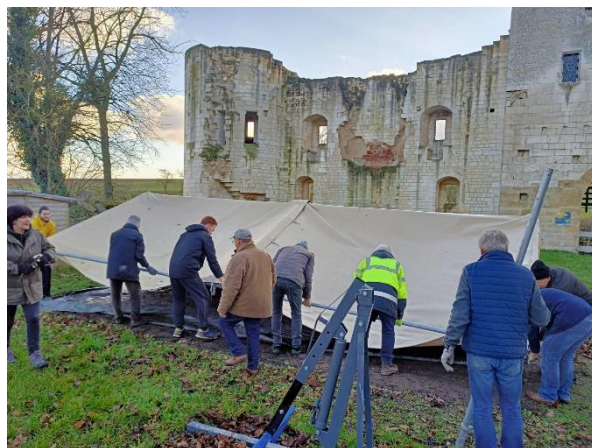
Le démontage du barnum, 28 novembre 2024