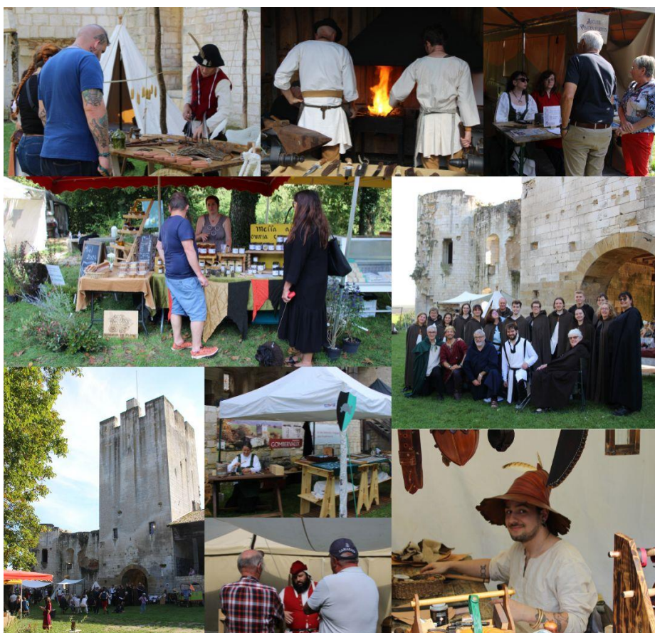
Les JEP en photos, 21 et 22 septembre

Une belle mélodie composée d'histoire médiévale, de partages, de chants et d'enclume a égayé la cour durant tout le week-end.