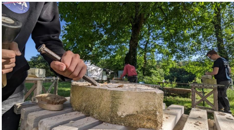
Taille de pierre, chantier juin-juillet 2024