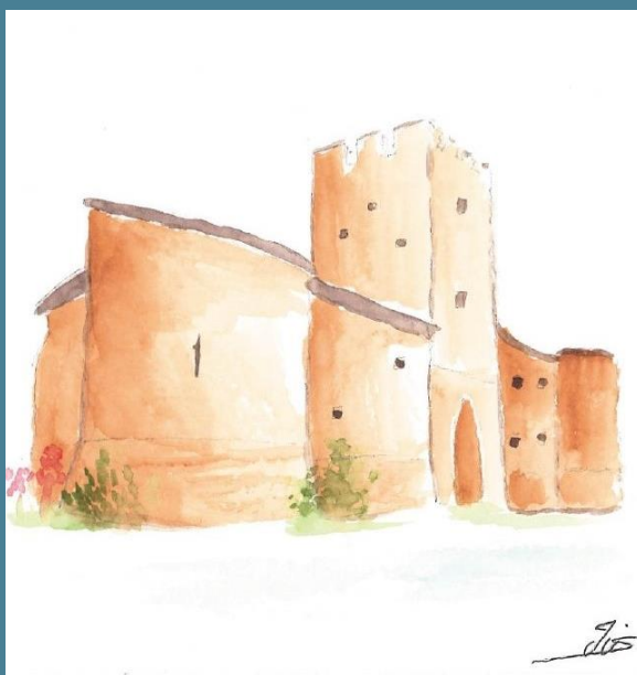
Aquarelle de Gombervaux peinte par Iris SOMMIER, bénévole au chantier calepinage de juin 2024