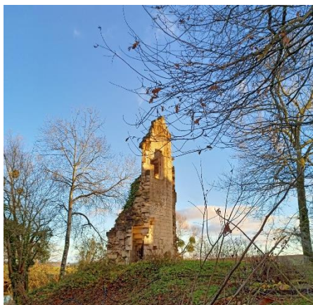
Tour semi effondrée, 22 octobre 2024

L'étude confiée à une architecte du patrimoine pour la sauvegarde de la tour semi effondrée et du mur de la cave, ainsi que la réfection de la toiture de la grande salle, a progressé.