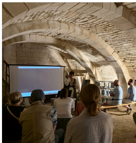
Retour en image des JEP 2025.

Ce sont près de 240 visiteurs qui ont participé à la manifestation. Le samedi, le soleil nous a souri et le dimanche, la pluie a pris sa revanche. Malgré la météo capricieuse du second jour, nos exposants et bénévoles étaient fièrement présents.