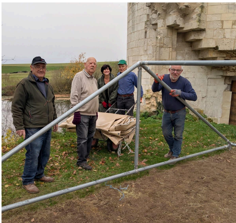
Photo de l'équipe de démontage