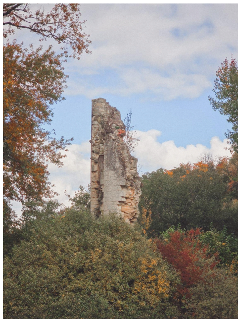
La tour Est, octobre 2025