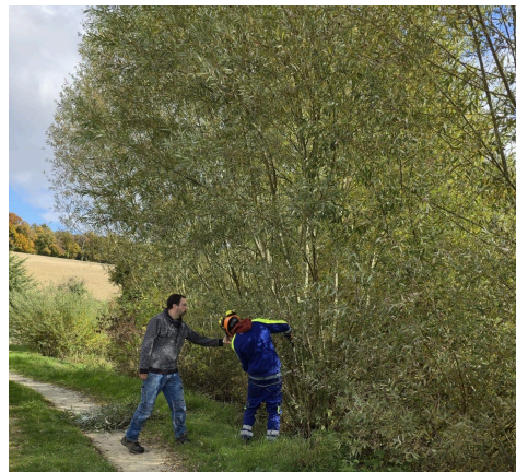
Les jeunes de l'IME avec leurs accompagnants et deux bénévoles locaux.